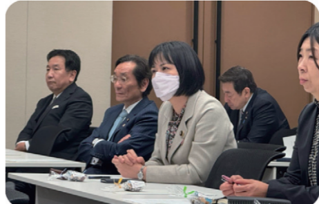
地方自治における公共交通のあり方を考える議員懇談会総会