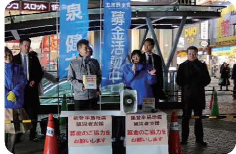
能登半島地震被災者支援募金活動