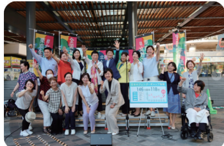
立憲民主党全国女性キャラバン