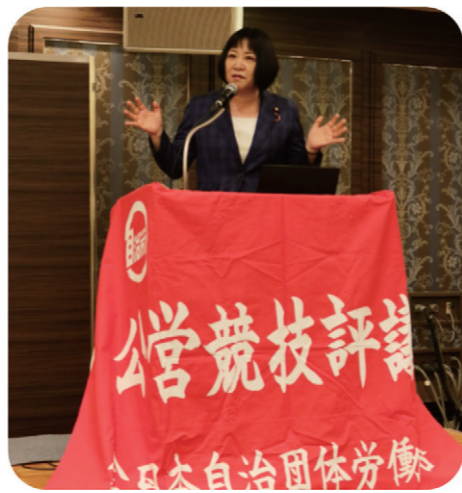
自治労公営競技評議会研究交流集会