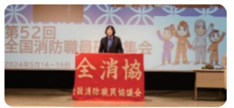
全消協全国消防職員研究集会