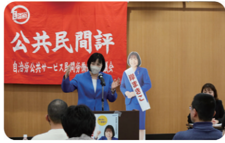
自治労公共サービス民間労組評議会春闘討論集会