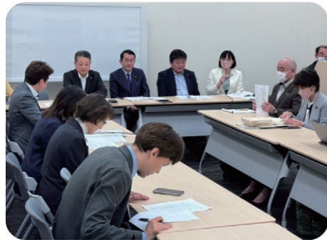
会派総務部門会議で自治労から地方自治法改正案についてヒアリング