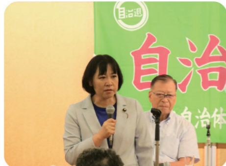
自治退県本部連絡会議で退職者の諸先輩に国会情勢を含めご挨拶