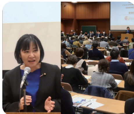
自治労社会福祉評議会「くらしとこどもの福祉を考える全国集会」