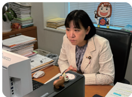
「全国コロナ後遺症患者と家族の会」とのWeb意見交換会