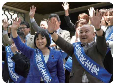
自治労全国町村職総決起集会国会請願行動