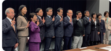
ミャンマーの民主化を支援する議員連盟院内集会