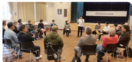
自治労沖縄県本部会計年度任用職員の勤労手当支給を実現する決起会議