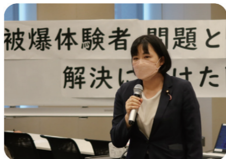
「被爆体験者」と「被爆二世」問題の解決に向けた院内集会