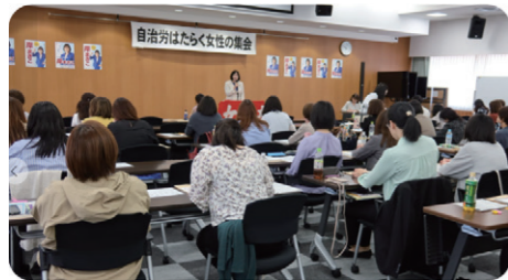
自治労はたらく女性の集会