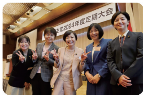
立憲民主党2024年度定期大会