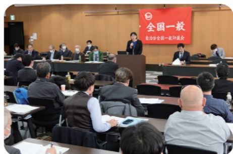
自治労全国一般評議会「地方労組代表者会議」