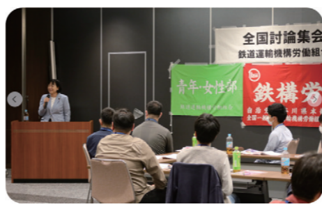
若手組合員が集う全国一般鉄道運輸機構労働組合「全国討論集会」