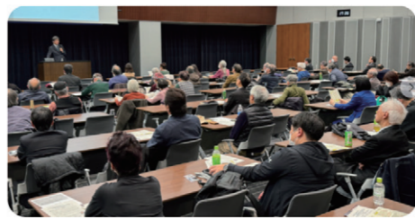
立憲フォーラム院内集会「憲法の平和主義を考える」勉強会