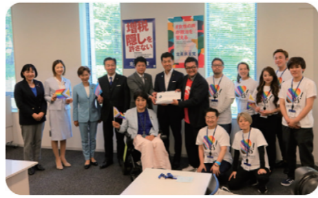
PRIDE CODE「結婚の平等」署名拝受