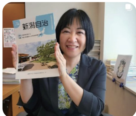
『新潟自治』第100号に改正地方自治法の懸念を寄稿