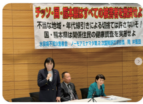
すべての水俣病被害者の一日も早い救済をめざす環境省交渉