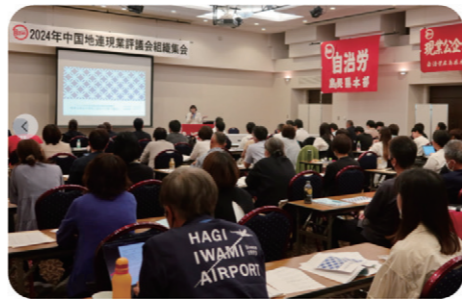
自治労中国地連現業評議会組織集会