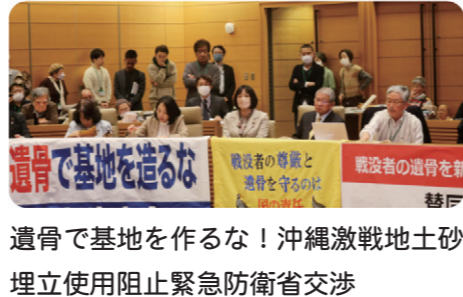
遺骨で基地を作るな！沖縄激戦地土砂埋立使用阻止緊急防衛省交渉