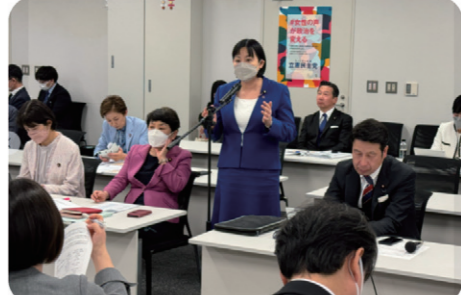
会派法務・子ども部門合同会議で連合から共同親権問題についてヒアリング