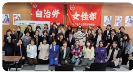
国際女性デーの女性ネットワーク