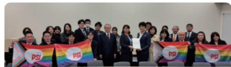
PSI-JC（国際公務労連加盟組合日本協議会）世界女性DAY要請行動