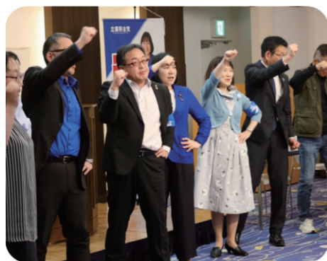
自治労香川県本部プレイボール集会