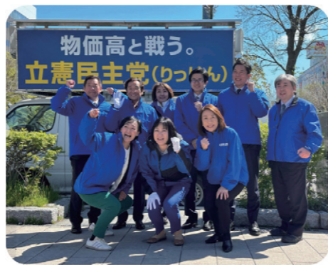
全道メーデー参加後の立憲民主党北海道連国会議員団による街頭演説会