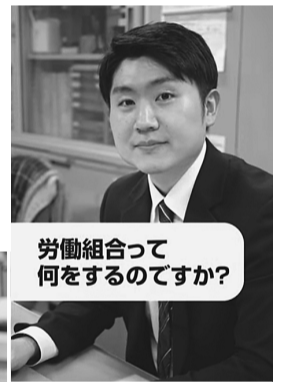
労働組合って何をするのですか?

て、視聴を呼びかけている。県本部の新採対策会議で「動画を作ろう」という話が出たのは2022年の初夏のころ。本部の「事業促進交付金」を原資に10月から制作に着手した。