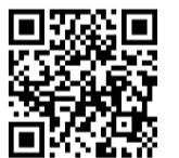
【埼玉】ようこそ自治労へ～4月から働くあなたへ～

「縦動画」のひとつでシ編マ(右)熊谷市役所から撮影風景。制作は、ナリオ作成から撮影、編集まで専門業者に発注。撮影は本格的な機材を職場に持ち込んでの撮影が高画質の映像が完成した(下)