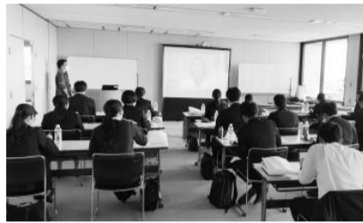
加須市職の組合説明会。今年、新規採用者23人が入庁

埼玉県本部はこの3月、新入職員にわかりやすく組合を紹介し加入を呼びかける動画を制作した。