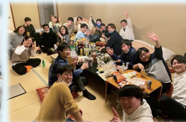
市町村役場や民間との交流