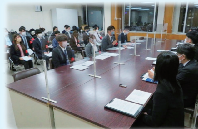
処遇改善のための交渉