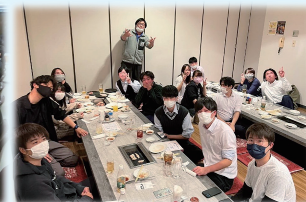
地域ごとの交流会（留萌）

道職員だけではなく、市町村役場や民間の組合員とも、職場や年齢の壁を超えた交流や学習の機会があります。