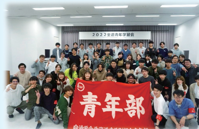
全道の道職員との学習会

男女30歳以下の組合員の集まりで、青年層職員だからこそその悩みや不満を解決するための組織です。