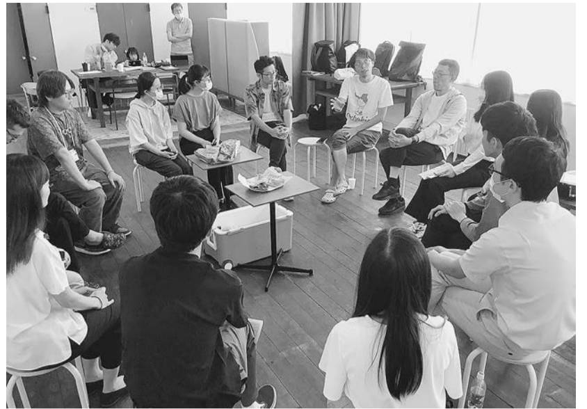
高校生や転職を希望する社会人も参加。地元新聞の紹介記事などを見た7人が来場

「面白くて、いろんな価値観を持つ人が働いていることを知った」「良い面も悪い面も素直に話してくれてありがたい」。参加した学生は最後にそう話した。