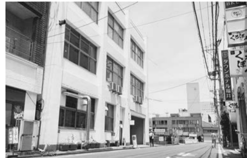
会場となった「LUFF Fukui Work&Studio」(白色の建物)は旧縫製学校の校舎を改装。シェアワークスペースなどが入る

「休みは取りやすい」「仕事を達成しても褒められない」。現役の自治体職員が職場の実際を語るイベントが開かれた。