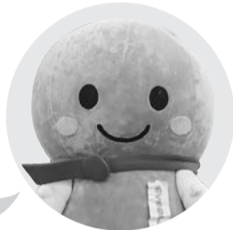
めぐるちゃん 自治労の 公式みずキャラクター