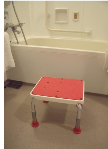
⑦背もたれのないイス