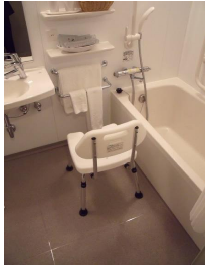
⑥通常の設置タイプ(背もたれあり)のイス