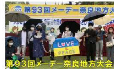
第93回メーデー奈良地方大会

2022年4月29日 組合員とその家族も合わせて18人の参加がありました。「プラカードコンテスト」と「デコレーションコンテスト」にエントリーし、それぞれ優秀賞と1位を受賞することが出来ました!