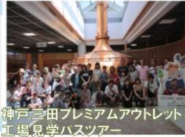
神戸三田プレミアムアウトレット & 工場見学バスツアー

2019年9月8日 組合員とその家族も合わせて46人の方の参加がありました。ビール工場の見学やシイタケ狩り、BBQを楽しんだ後、アウトレットで買い物を楽しみながら、家族や組合員同士の仲を深めることができました。