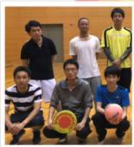
青年部・女性部 スポーツ交流会にて。

35歳以下の男性組合員で構成され、2023年3月末において、13人のメンバーで活動しています。青年部・女性部スポーツ交流会等を通して、様々な方と親睦・交流を深めています。2022年度は4人の新規採用職員が青年部に加わりました。新型コロナウイルスの影響で活動が大きく縮小していますが、みんなで一緒に盛り上げていきましょう！