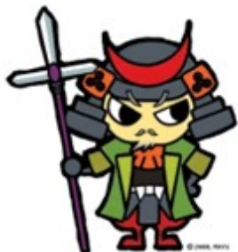
左近くん (モデルは鳴左近)