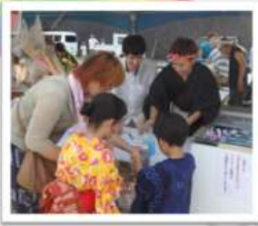
へぐり盆踊り(2019年) に出店しました。