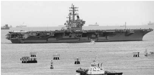
9月29日、横須賀港を出る「ロナルド・レーガン」

今、改めて米軍基地の縮小・撤去、改憲・軍事力強化反対の、全国的な取り組みが求められている。