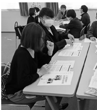
分散会で生活や働き方を交流する参加者

さんではなくてはならない存在であり、処遇が不安定だと私たちの働き方にも影響する。ともに働く仲間として活動していけるよう組合加入にむけて、真摯な議論をお願いする」とあいさつ。