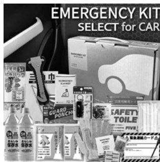
防災セット・車載用