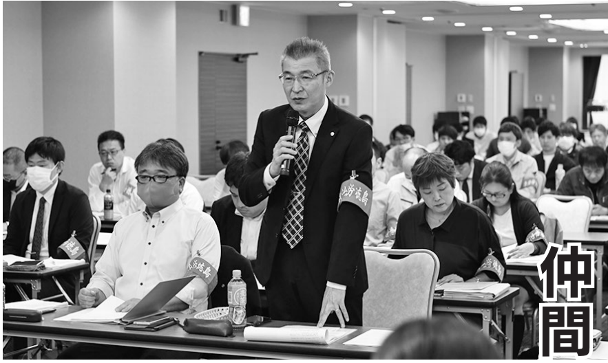
適正な「制度運用」や「時間外労働の把握」にむけた助言を求めた

自治労県本部は、11月1日、ホテル千秋閣で、県市町村課と、地方財政確立や2023年度賃金改定・格差解消と賃金水準の維持・改善などについて交渉を行った。