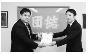
小島県市町村課長(右)に女性部・青年部で集約した1010枚の要請書を渡す西條青年部長(左)

2時間にわたる交渉では、「若年層が労働状態や人間関係に悩み働きづらくなっている」「事業に追われ体育