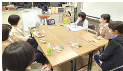
▲他地域の動向も聞けて有益でした!

但し、支給が実現するためには条例の改正が必要となりますので、今後とも実行化に向けて取り組んで参ります。