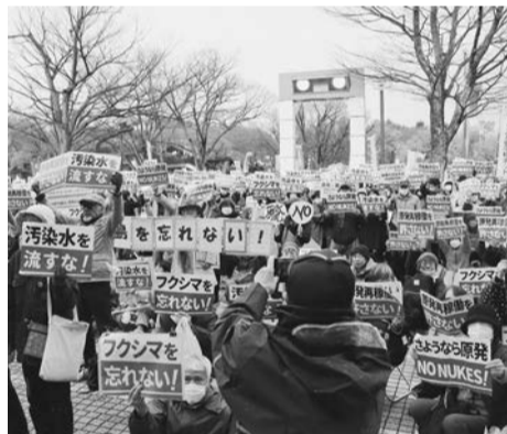
「福島を忘れない」「汚染水を流すな」のプラカードも(写真)。志賀原発の下には活断層が走る(左図参照)

「響け「志賀原発を廃炉に」 福島を忘れない」の声. 3月20日、東京・代々木 国集会」が開催され、全国公園で「さようなら原発全 から60000人(自治労4500人)が参加した。集会では、能登半島の被災地計画されてきた「珠洲原発」を止め、道行く人に脱原発をアピール。歩道からはデモ隊の訴えに呼応し「原発いらない!」と応える若者や外国人観光客もいた。