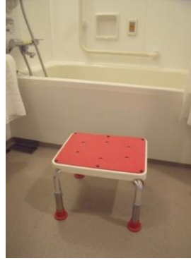
⑦背もたれのないイス