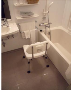
⑥通常の設置タイプ(背もたれあり)のイス